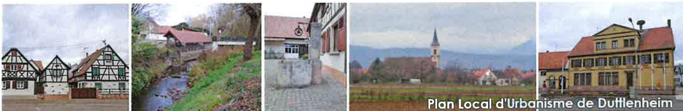
Plan Local d'Urbanisme de Duttlenheim