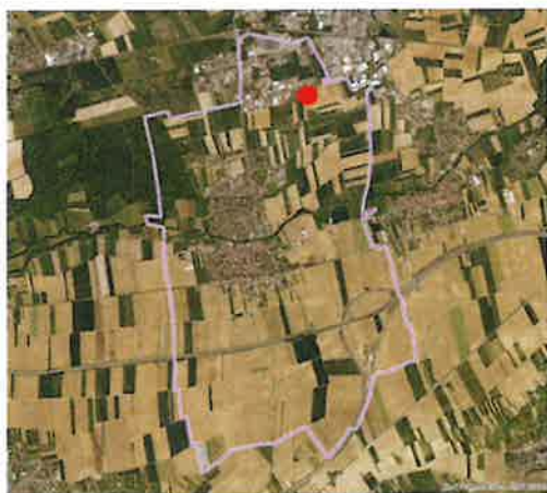
Visualisations du secteur concerné

La révision allégée n°1 a vocation à réintégrer une parcelle de 25 ares en zone urbaine pour permettre le développement sur site d'une entreprise. Cette évolution, bien qu'en réduisant la zone agricole, ne conduit à aucune distraction d'espace agricole, la parcelle ayant été artificialisée dans le cadre des travaux du COS.